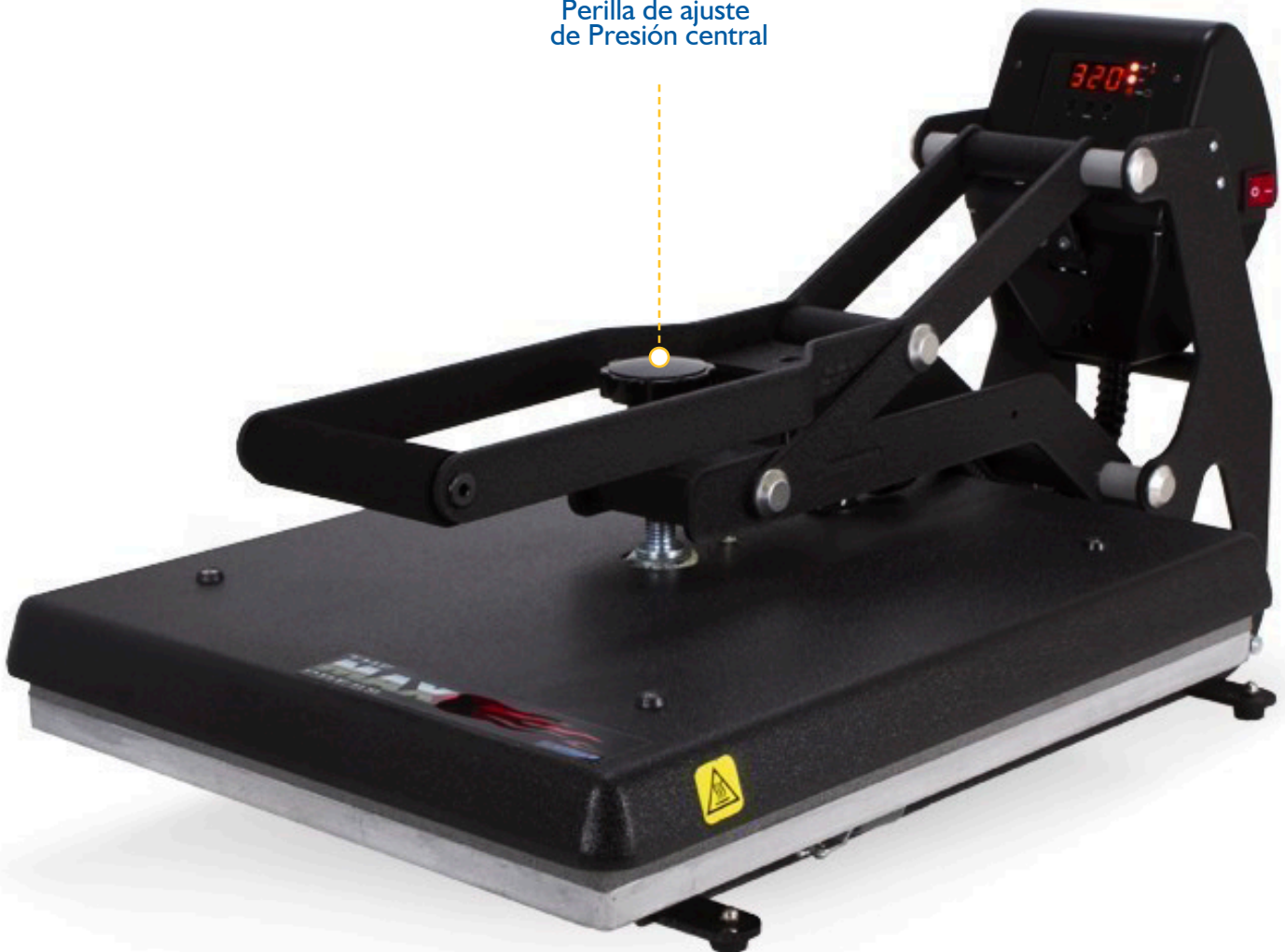
Perilla de ajuste de Presión central